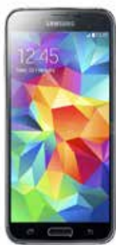
Samsung Galaxy S5

Gli smartphone possono quindi essere definiti i “telefoni di internet”, proprio perché esprimono al massimo le loro potenzialità quando sono connessi alla rete. Caratteristica fondamentale degli smartphone è infatti la possibilità di accrescere le proprie funzionalità attraverso l’installazione di programmi applicativi, le ormai note app.