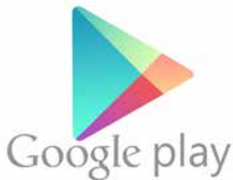
Logo Google Play Store

Anche in questo caso la filosofia è sempre la stessa: esiste un negozio, lo store Microsoft, al quale l'utente si collega e scarica le applicazioni di suo interesse.