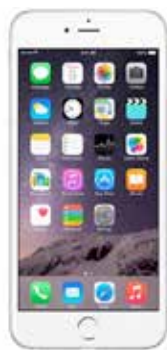
Apple iPhone 6

Allo stesso modo dei tablet anche gli smartphone hanno i loro sistemi operativi e i loro negozi virtuali nei quali poter acquistare o scaricare gratuitamente tutti i contenuti che andranno a personalizzare il vostro dispositivo.