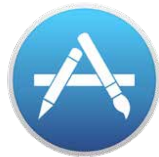
Logo App Store