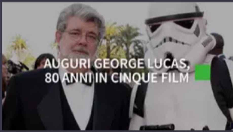
▶ Auguri George Lucas, 80 anni in cinque film