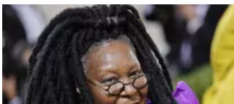
Whoopi Goldberg, ho offerto al Papa una parte in Sister Act 3