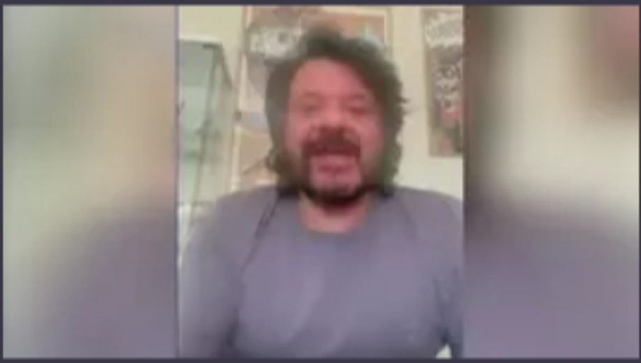
▶ Lillo lancia Music@Mens