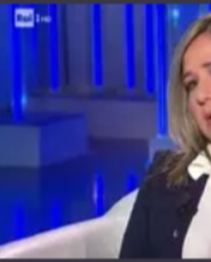
▶ Piera Mag Domenica In: sapere chi e'