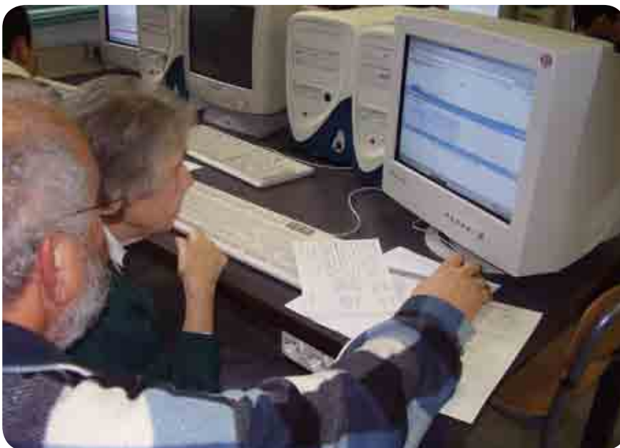
Nonna e Docente I.T.I.S "G. Armellini" di Roma

Dal punto di vista didattico, i protagonisti di questa seconda parte della lezione sono i tutor, ai quali è affidato il compito di assistere i nonni nell'esecuzione degli esercizi assegnati e di fornire loro spiegazioni teoriche e/o pratiche ogni volta che esse vengano richieste (anche in maniera non esplicita, ovviamente).