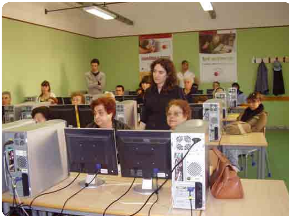
Lezione presso L.S.S "I.Newton" di Roma

La prima lezione di ogni corso può però avere una configurazione diversa e peculiare, poiché corrisponde al momento dell'accoglienza dei nonni. Per la descrizione di questa fase si veda più oltre la Parte IV.