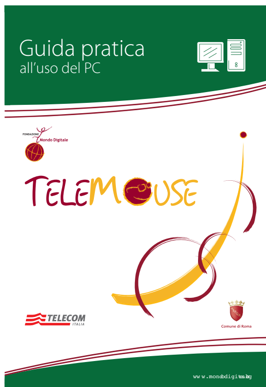
Copertina della Guida realizzata dalla Fondazione Mondo Digitale

I contenuti del corso sono già articolati e organizzati in unità didattiche nel Manuale di Telemouse .