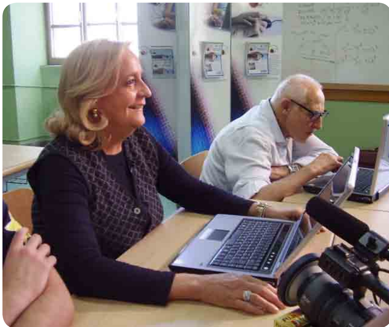
nonni al computer presso la Scuola L.S.S. "I. Newton" di Roma