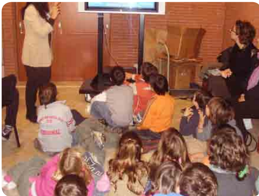
Esempio in cui i docenti spiegano ai tutor come comportarsi

Bisogna però ricordare che i tutor sono pur sempre dei ragazzi (a volte bambini), e che, se mandati a fare Telemouse come veri e propri dilettanti allo sbaraglio, possono creare molti problemi: