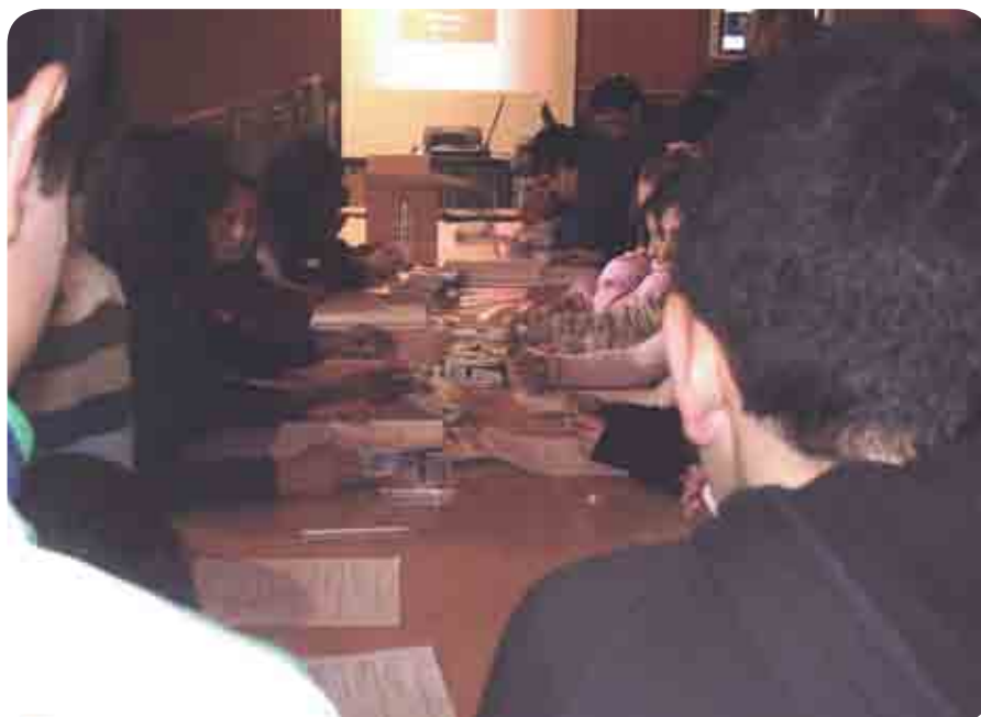
Esempio di incontro preliminare tra docenti e tutor

Questo incontro preliminare è inoltre l'occasione giusta per ascoltare le aspettative dei tutor nei confronti di Telemouse.