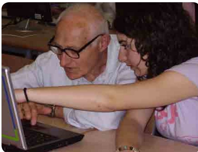
Nonno e tutor L.S.S “I.Newton” di Roma

Al termine della lezione frontale, ai nonni possono sorgere dubbi su quanto appena spiegato. Le loro richieste di chiarimento, per quanto banali o ripetitive, non vanno mai trascurate o ignorate, anzi andrebbero sollecitate perché sono la garanzia dell'esistenza di un rapporto di fiducia con l'insegnante e di un clima rilassato e informale in cui i nonni non hanno timore di esporsi.