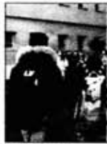
Bambini a scuola

N ESSUN inasprimento delle pene in stile francese, ma responsabilizzazione degli studenti più adulti nei confronti dei più piccoli, oltre all'utilizzo della tecnologia come deterrente per le manifestazioni di violenza e un forte incremento delle attività sportive e culturali. È questa la ricetta anti bullismo made in Italy annunciata ieri dal ministro delle Politiche giovanili, Giovanna Melandri, durante il convegno “Le nuove frontiere del bullismo” organizzato nell'aula magna dell'istituto tecnico Galileo Galilei di via Conte Verde, nella zona di piazza Vittorio. E a cui hanno partecipato anche l'assessore capitolino alla Scuola, Maria Coscia e il presidente del Consorzio giovanidigitale ed ex ministro della Pubblica Istruzione Tullio De Mauro.