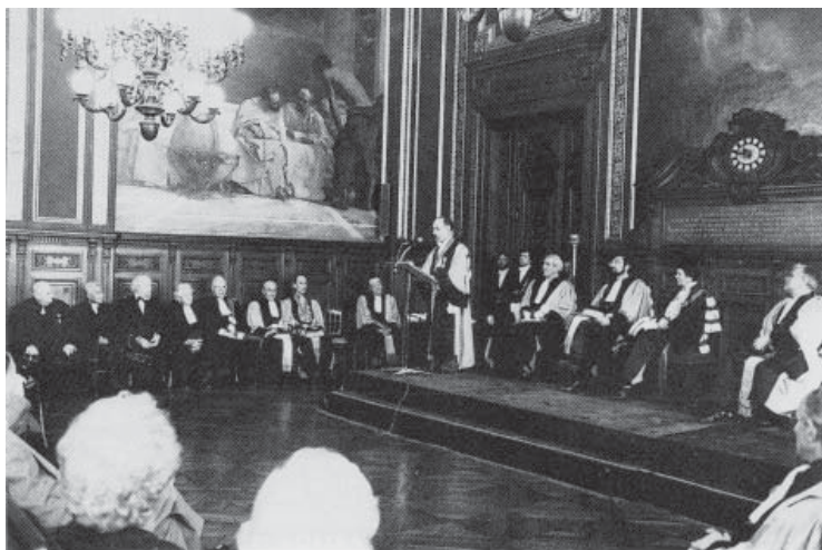
Réception de docteurs honoris causa dans les Grands Salons du Rectorat (1983)