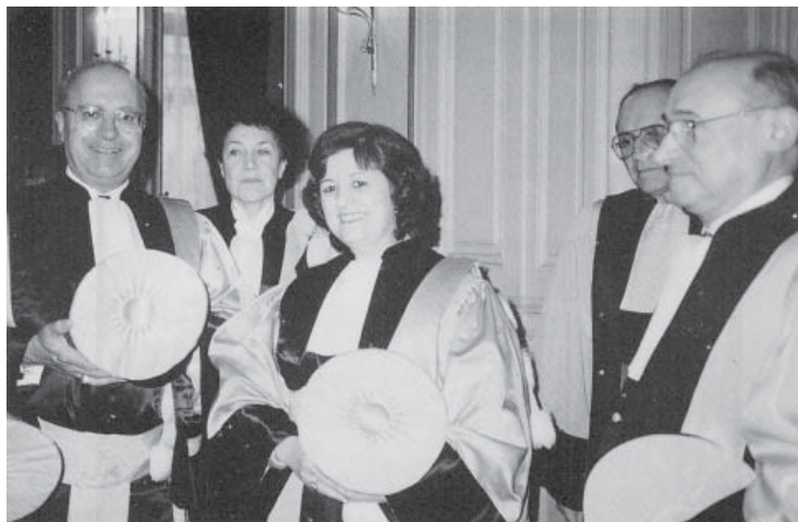
Professeurs en toge à l'occasion de la cérémonie de réception des docteurs honoris causa (1989)