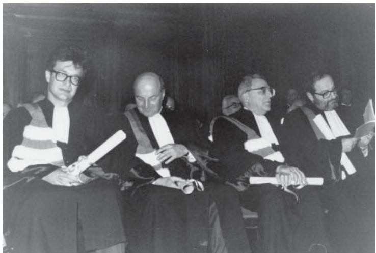
Docteurs Honoris Causa 1989